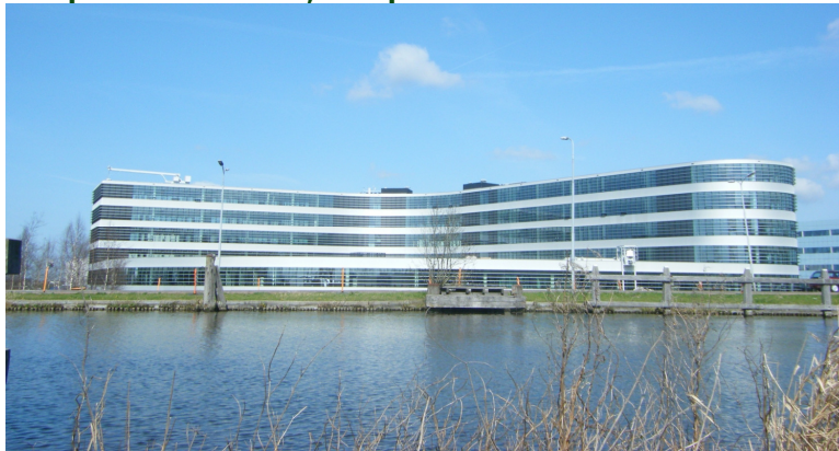
Foto 4: TransPort-gebouw

Aanleiding: Amsterdam Airport Schiphol heeft de ambitie dat in 2012 al haar activiteiten CO 2 -neutraal zijn. De grootste bijdrage aan dit klimaatplan is afkomstig uit de vastgoedportefeuille. De ontwikkeling van het TransPort-gebouw is hierbij een testcase. Doelstelling is een BREEAM- en/of een LEED-certificaat.